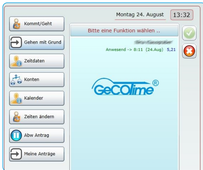
Abb.: Erfassen von Ereignissen in der Zeitwirtschaft mit Webterminal

Mit dem Modul WEBTERMINAL kann zusätzlich die Erfassung von Zeitereignissen (Kommen, Gehen, Auftragsanfang, Auftragsende, etc.) online erfolgen. Weiters ist die Nutzung zusätzlicher Softwaremodule wie z.B. WORKFLOW möglich. Das WEBTERMINAL kann über jeden PC mit einem Browser und Internetverbindung verwendet werden. Die Identifikation und Prüfung der Berechtigung erfolgt über Eingabe der Personal- oder Ausweisnummer und eines PIN Codes. Die Erfassungsmasken können funktions- und personenbezogen frei konfiguriert werden.